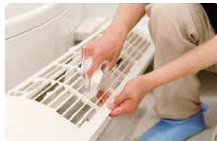
部品をひとつひとつ丁寧に洗います。

* お掃除の途中で分解が難しいと判断した場合は、当日スタッフがご相談させていただきながら進めさせていただきます。 * 経年劣化、構造上の理由等で、当日のスタッフの判断により、故障、破損等を避ける為に分解できる範囲で作業をする事をご了承ください。 * 機種によって対応できない場合があります。