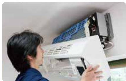
本体カバー・フィルター等を分解します。

*1 早トクキャンペーンとこころまち会員割引を含む *2 表記価格は*1と複数台まとめ割引を含む *すべて税込価格で表記しています。