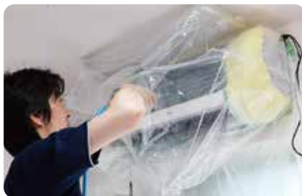
しっかりと養生して内部を高圧洗浄。